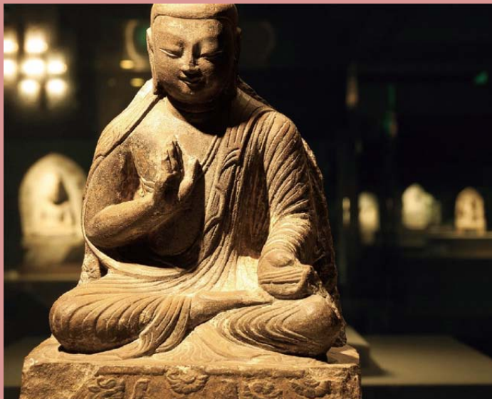
如来坐像 北魏・天安元年(466) 大阪市立美術館 山口コレクション