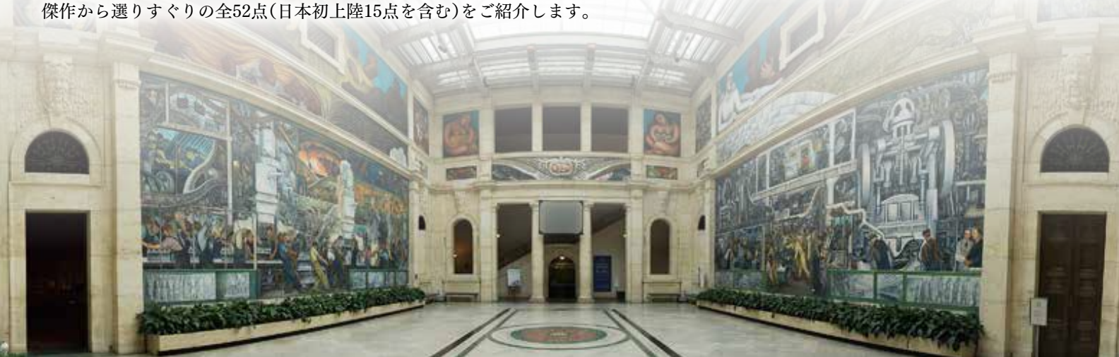
アメリカ・デトロイト美術館内 The Rivera Court

このデトロイト美術館が存続の危機に陥ったのが2013年7月のデトロイト市の財政破綻でした。市の深刻な財政難により、収蔵する美術品の売却の危機も取り沙汰されました。しかし国内外からの資金援助により、美術品は売却されることなく存続しました。危機を乗り越え、今なお美術館のコレクションの中核を成している印象派、ポスト印象派、そして20世紀のフランス、ドイツの数々の傑作から選りすぐりの全52点(日本初上陸15点を含む)をご紹介します。