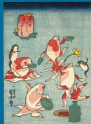
歌川国芳「金魚づくし 酒のざしき」ベルギー王立美術歴史博物館