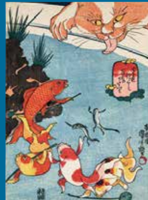
歌川国芳「金魚づくし 百ものがたり」ベルギー王立美術歴史博物館

江戸における戯画の大手といえは歌川国芳(1797-1861)をおいて他にいないでしょう。国芳の手にかかれば猫や金魚たちもまるで人間のように画中を生き生きと動き回り、独楽や化粧道具までもが擬人化されて楽しい世界を繰り広げます。