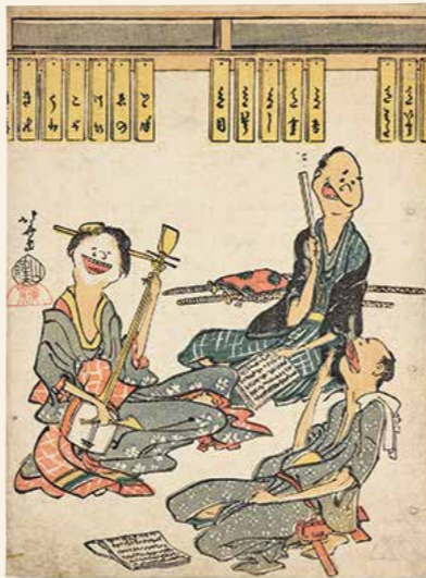
葛飾北齋「鳥羽絵集会 お稽古」ベルギー王立美術歴史博物館

富士を描いた浮世絵で世界的に有名な葛飾北齋(1760-1849)も、戯画を手掛けています。主なシリーズに「鳥羽絵集(会)」や「風流おどけ百句」などがあり、その小さな画面には北齋の巧みな筆づかいにより躍動感あふれる人々が描かれています。