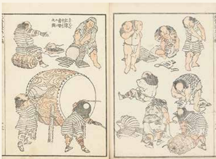
葛飾北齋『北齋漫画』九編 浦上満氏蔵

北齋の描いた絵手本として知られる『北齋漫画』にも戯画的な要素が多く含まれています。よくに『北齋漫画』十一編はほぼ戯画のみで構成されており、北齋の戯画を知るうえで注目すべきものです。