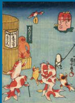
歌川国芳「金魚づくし さらいとんび」ベルギー王立美術歴史博物館