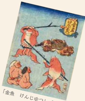
「金魚 けんじゆつ」 個人蔵

「金魚づくし」シリーズは、現在9図が確認されています。9図目の「きんぎょづくし ぼんぼん」は、2011年に「没後150年 歌川国芳展」(大阪市立美術館ほか)で初公開され、この発見により10図目制作の可能性が高まりました。では、その幻の10図目とは一体どんなものだったのでしょうか。そのヒントになるのが上方で出版された「金魚 けんじゆつ」です。この図を描いた絵師は不明ですが、上方では江戸の浮世絵を縮小して写したものが多く制作されていることから、「金魚 けんじゆつ」も国芳が描いた幻の10図目を写した可能性が考えられるのです。幻の10図目は、まだどこかに眠っているかもしれません!