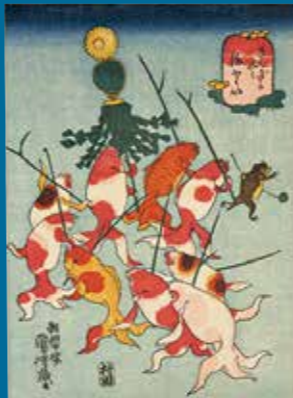
歌川国芳「きんぎょ尽 まとい」ベルギー王立美術歴史博物館