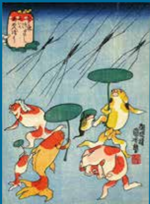
歌川国芳「金魚づくし にはかあめんぼう」ベルギー王立美術歴史博物館