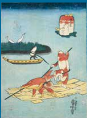
歌川国芳「金魚づくし いかだのり」 個人蔵