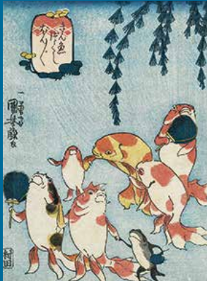
歌川国芳「きんぎょづくし ぼんぼん」 個人蔵