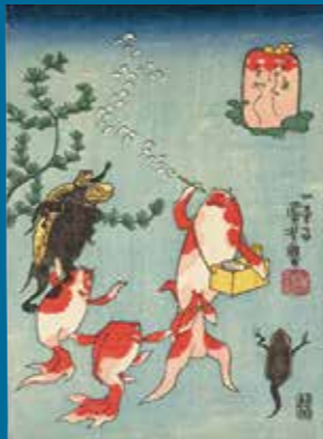
歌川国芳「金魚づくし 玉や玉や」ベルギー王立美術歴史博物館