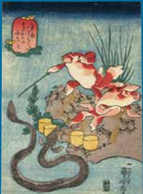
歌川国芳「金魚づくし すさのおのみこと」ベルギー王立美術歴史博物館