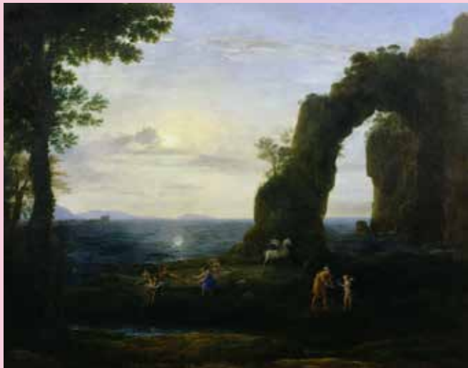
クロード・ロラン 《ペルセウスと珊瑚の起源》 1673年 油彩、カンヴァス ホウカム・ホール、レスター伯爵コレクション