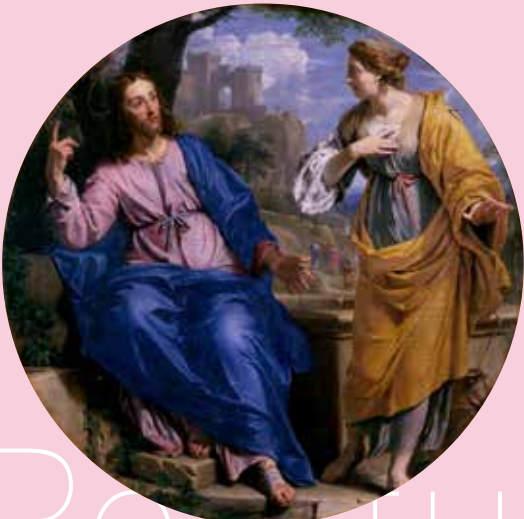
フィリップ・ド・シャンパーニュ 《キリストとサマリヤの女》 1648年 油彩、カンヴァス カーン美術館 Musé des Beaux-Arts de Caen