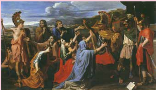
ニコラ・プッサン 《コリオラスに哀訴する妻と母》 1652-1653年頃 油彩、カンヴァス レザンドリー、ニコラ・プッサン美術館