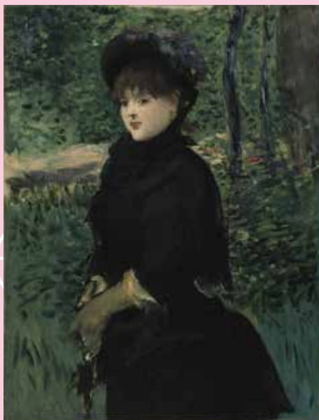
エドゥアール・マネ 《散歩》 1880年頃 油彩、カンヴァス 東京富士美術館

本展では、フランス絵画の最も偉大で華やかな3世紀をたどります。17世紀の「大様式」と名づけられた古典主義から、18世紀のロココ、19世紀の新古典主義、ロマン主義を経て、印象派誕生前夜にいたるまでの時代です。ヴェルサイユ宮殿美術館やオルセー美術館、大英博物館、スコットランド・ナショナル・ギャラリーなど、フランス、イギリスを代表する20館以上の美術館の協力のもと、油彩画、素描あわせて約80点の名品が集結しました。※新型コロナウイルスの影響で、展示作品が一部変更になりました