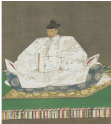
《豊臣秀吉像》(部分) 慶長5年(1600) 惟杏永哲賛 本館蔵(古賀勝夫氏寄贈)

の全4章にわたり約80点で構成する予定で準備を進めています。徳川氏にゆかりある美術工芸品に比べれば、敗者である豊臣氏のそれは圧倒的に現存数が少ないのですが、御用絵師・