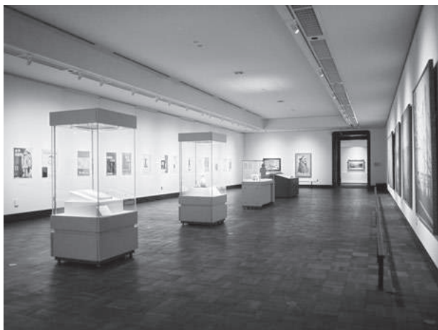
歩みとコレクション展 第1章展示風景