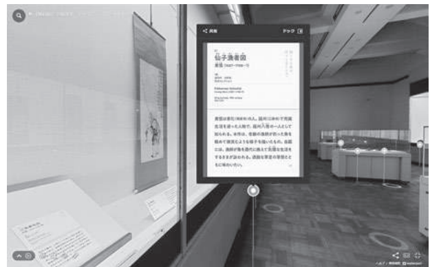
華風到来展 VRミュージアム画面 第1章展示風景、キャプション表示画面