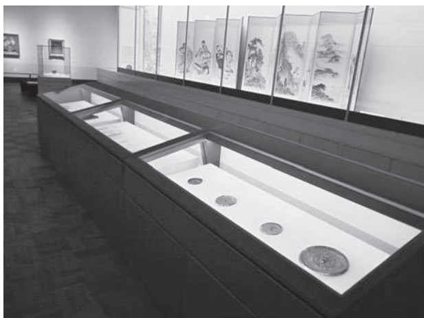
華風到来展 第3章展示風景