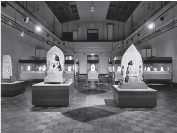
華風到来展 第4章展示風景