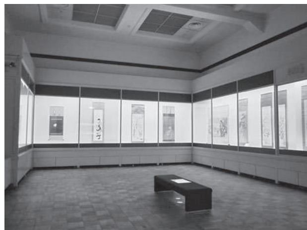
華風到来展 第3章展示風景