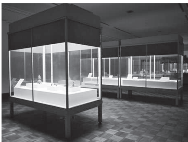
歩みとコレクション展 第2章展示風景