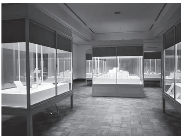
歩みとコレクション展 第2章展示風景