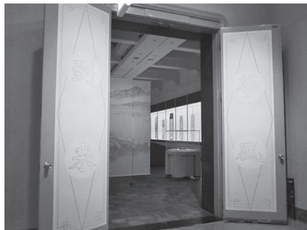
華風到来展 展示室入口