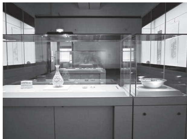
華風到来展 第1章展示風景