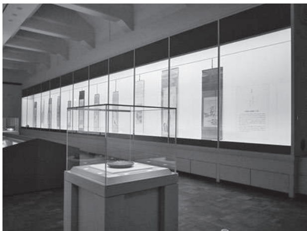
華風到来展 第1章展示風景