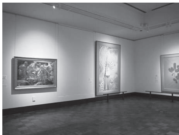
歩みとコレクション展 第2章展示風景