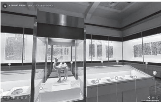
華風到来展 VRミュージアム画面 第2章展示風景