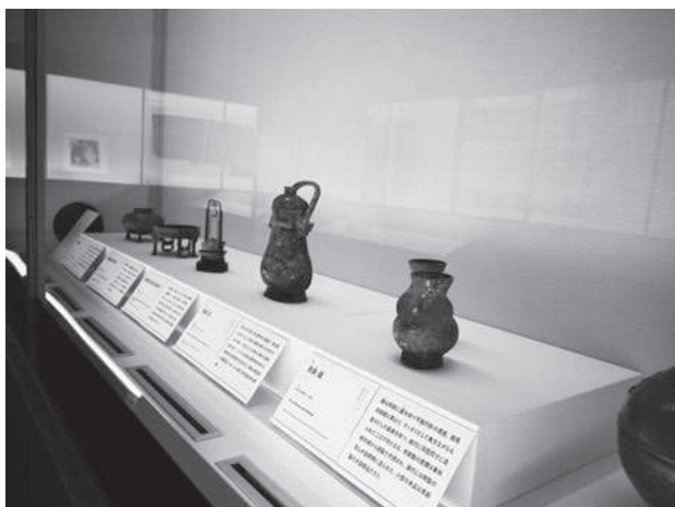
華風到来展 第2章展示風景