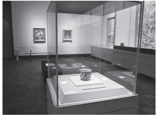
華風到来展 第3章展示風景