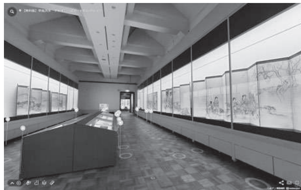
華風到来展 VRミュージアム画面 第3章展示風景