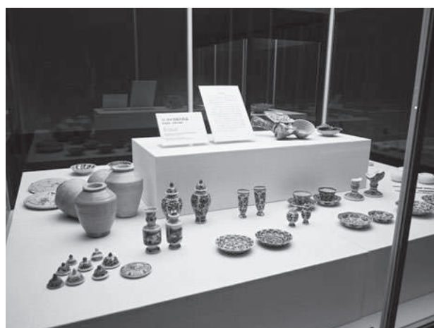
歩みとコレクション展 第2章展示風景