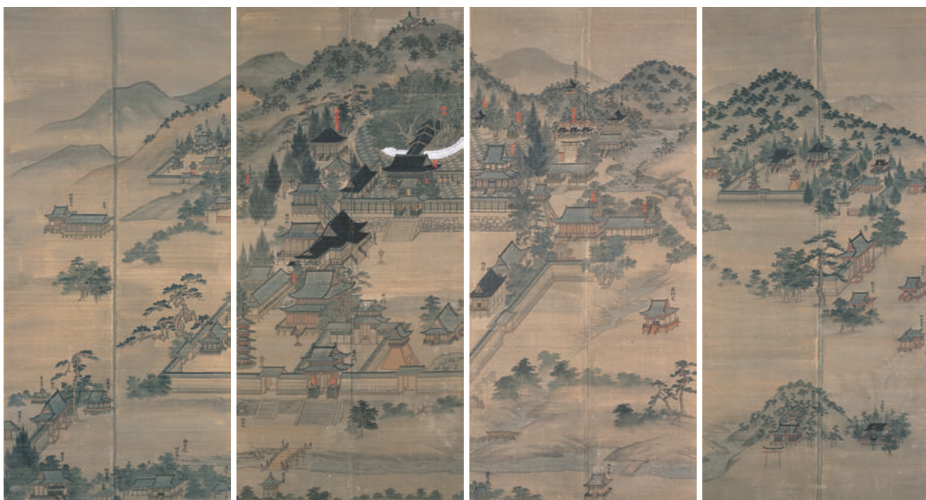
【口絵2】「叡福寺境内古絵図」 叡福寺蔵（論文「画僧 漲川・夢幻・独長 一画事と史料の再発見一」参照）