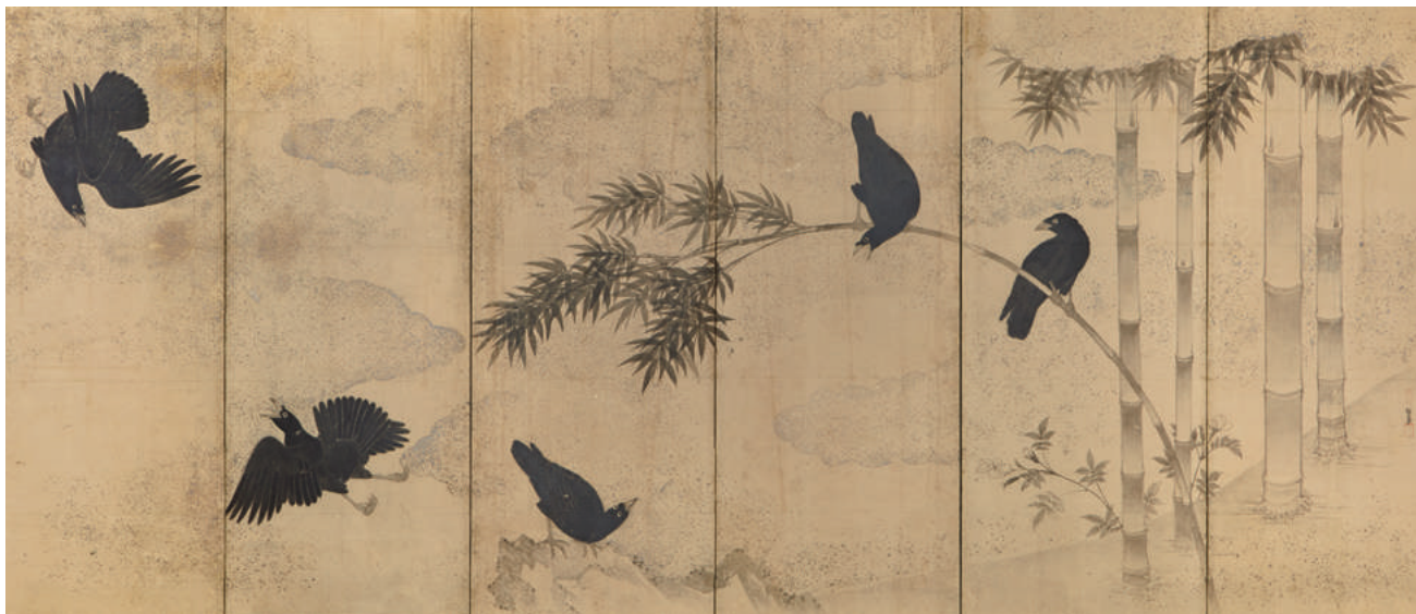
【口絵1】「竹に吠々鳥図屏風」 大阪市立美術館蔵（田万コレクション）（論文「画僧 漲川・夢幻・独長 一画事と史料の再発見一」参照）