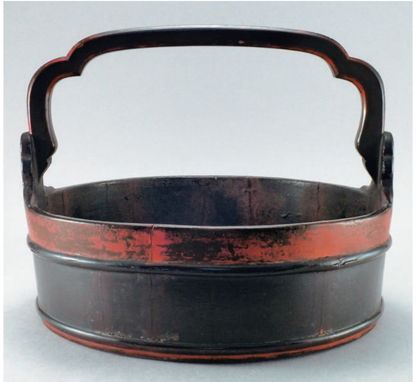
【口絵3】《菜桶》鎌倉時代・徳治二年 個人蔵

（研究ノート「法華寺・徳治二年銘《菜桶》（個人蔵）について—根来塗研究の基礎として—」参照）