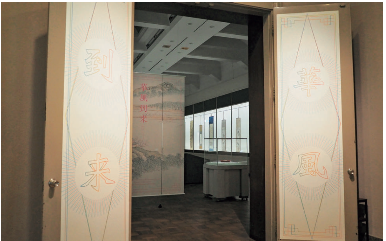
【口絵6】華風到来展 会場入口（展覧会記録「特別展 華風到来 チャイニーズアートセレクション」参照）

（研究ノート「法華寺・徳治二年銘《菜桶》（個人蔵）について—根来塗研究の基礎として—」参照）