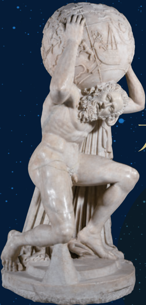
《ファルネーゼのアトラス》 西暦2世紀 大理石 高さ193cm、直径102cm ナポリ国立考古博物館 Artwork on loan from the National Archaeological Museum of Naples (MANN).